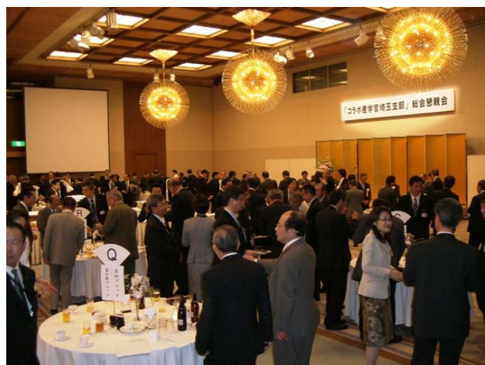
【写真：懇親会の会場Ⅰ】

ンシップバンキング（地域密着型金融）の推進を図り、地元埼玉の発展のために今後も努力していく内容となっております。