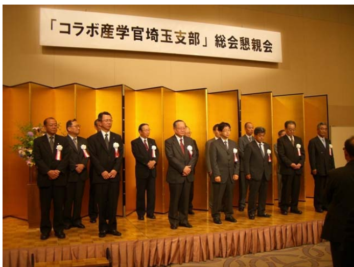
【写真：コラボ産学官埼玉支部の役員の方々】