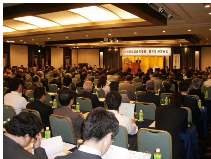
【写真：参加者でいっぱいの会場】