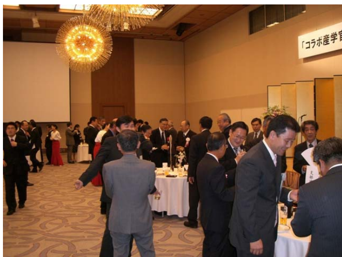
【写真：懇親会の会場Ⅰ】

ンシップバンキング（地域密着型金融）の推進を図り、地元埼玉の発展のために今後も努力していく内容となっております。