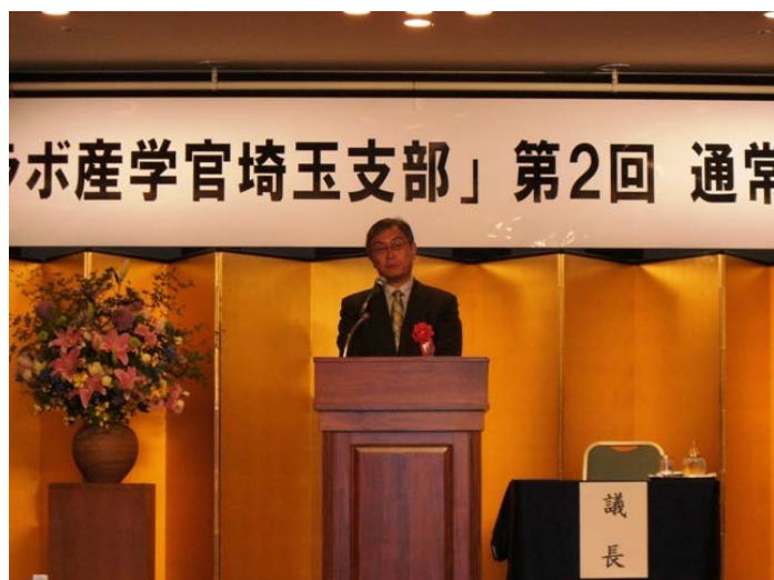
【写真：経済産業省 関東経済産業局地域経済部長 横田 真氏】