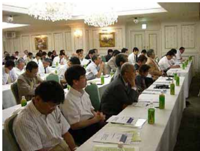
【会場は聴講者の方々が満席でした】