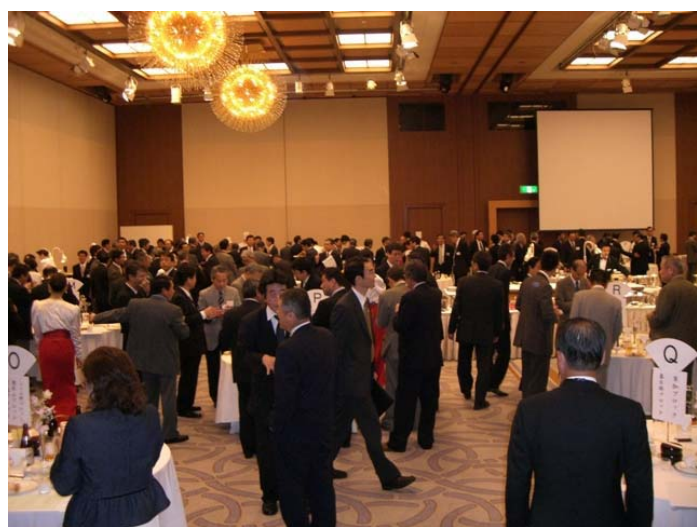
【写真：懇親会の会場Ⅰ】

「さいたま緑のトラスト資金」への協力、「彩の国ビジネスアリーナ2008」のお手伝い、さいしん福祉財団のリフレッシュ旅行、さいしん旅の生きがい大学、さいしん海外旅行、浦和レッズ応援定期預金の発売、最年少プロゴルファー石川遼選手のCM起用（石川選手の父親がさいしんの職員であることからCM起用となりました）等の諸施策を通じて「さいしん」は、リレーシヨ