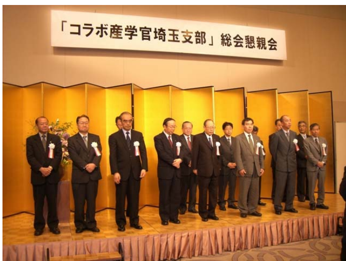
【写真：コラボ産学官埼玉支部の役員の方々】

会宴に先立ちコラボ産学官埼玉支部の役員の方々にご登壇頂き、事務局よりご紹介をいたしました。