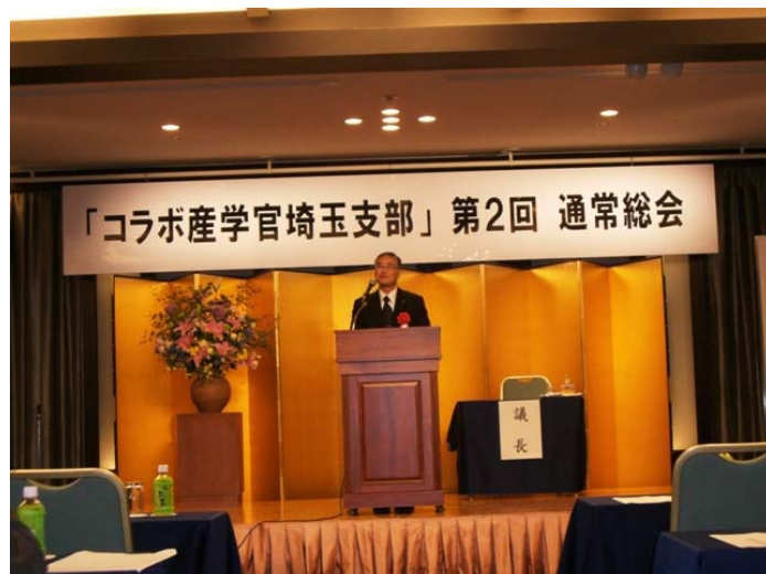
【写真：埼玉県産業労働部長 浅賀 康夫氏】