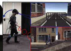
坂を上げる体験を作るシステム