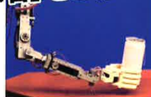
遠隔操作が可能なロボットアーム