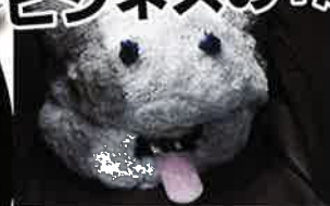
親愛表現をするロボット(りっかーたん)