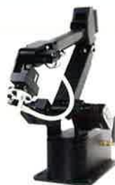
株式会社 MTMシステムズ

Inclination Manipulator は、実際には平らな道を歩きながら坂を上る体験を作るシステムです。坂を上る時に身体が後ろに倒れそうになる感覚を触覚刺激によって表現することで、歩いている道が実際よりも傾いているかのように錯覚させます。