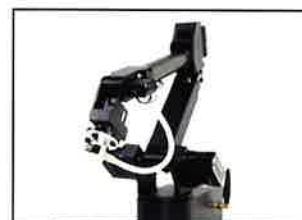
卓上サイズのロボットアーム