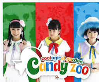
キャンディ zoo ナイトメア

MTM システムズは卓上サイズのロボットアームを用いた受託開発を手がける電通大発企業です。人手不足問題解消に向けたロボットソリューションの提案をすすめております。