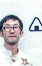
三星 安澄 MITSUBOSHI DESIGN

チラシやパッケージ、さらには展示ブースでの見せ方について、グラフィックデザインの観点から考え方を学びます。また、商品写真を撮るときのコツをプロから学び、商品の広報などに生きる力をつけます。