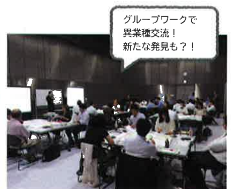
※ 平成 29 年度商品企画デザイン塾の様子