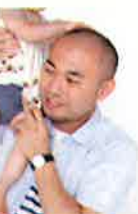
阿部 良寛 カメラマン

1980年東京都生まれ。早稲田大学理工学部建築学科卒業。在学中より野老朝雄に師事。卒業と同時に独立し、三星デザインを設立。ロゴのデザインからエディトリアル、パッケージ、サインデザイン、ペーパープロダクトなど、グラフィックを通じてデザイン活動を行う。